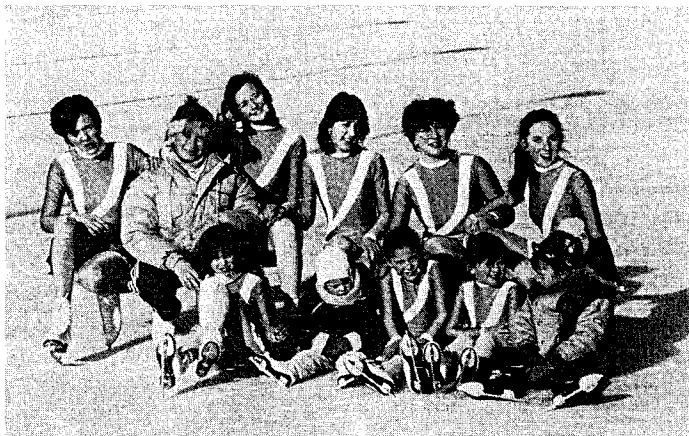
La squadra dei giovanissimi pattinatori pragelatesi.

Buona ultima, ma sempre più affollato luogo di incontro-ritiro, è la pista naturale di pattinaggio su ghiaccio (aperta da dicembre a febbraio) con bar, spogliatoi e noleggio pattini: salti e volteggi, capitolombi e risate genuine hanno furoreggiato e riempito nelle vacanze natalizie