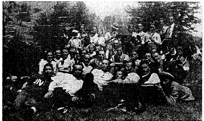
Fète de Sèleiraut, 5 d'aut 1939.